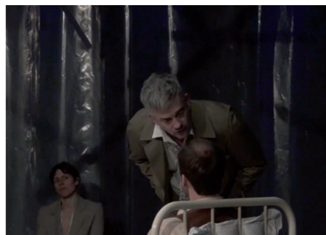
'Misdaad en Straf'

"Ik zou een nieuwe camera kopen ( lacht ). De camera's waarmee ik nu zelf film, kunnen bijvoorbeeld geen 4K meer aan, en ik merk dat er soms een foutje durft te sluipen in hun synchronisatie van geluid en beeld. Bij nieuwe camera's heb je dat gelukkig niet meer."