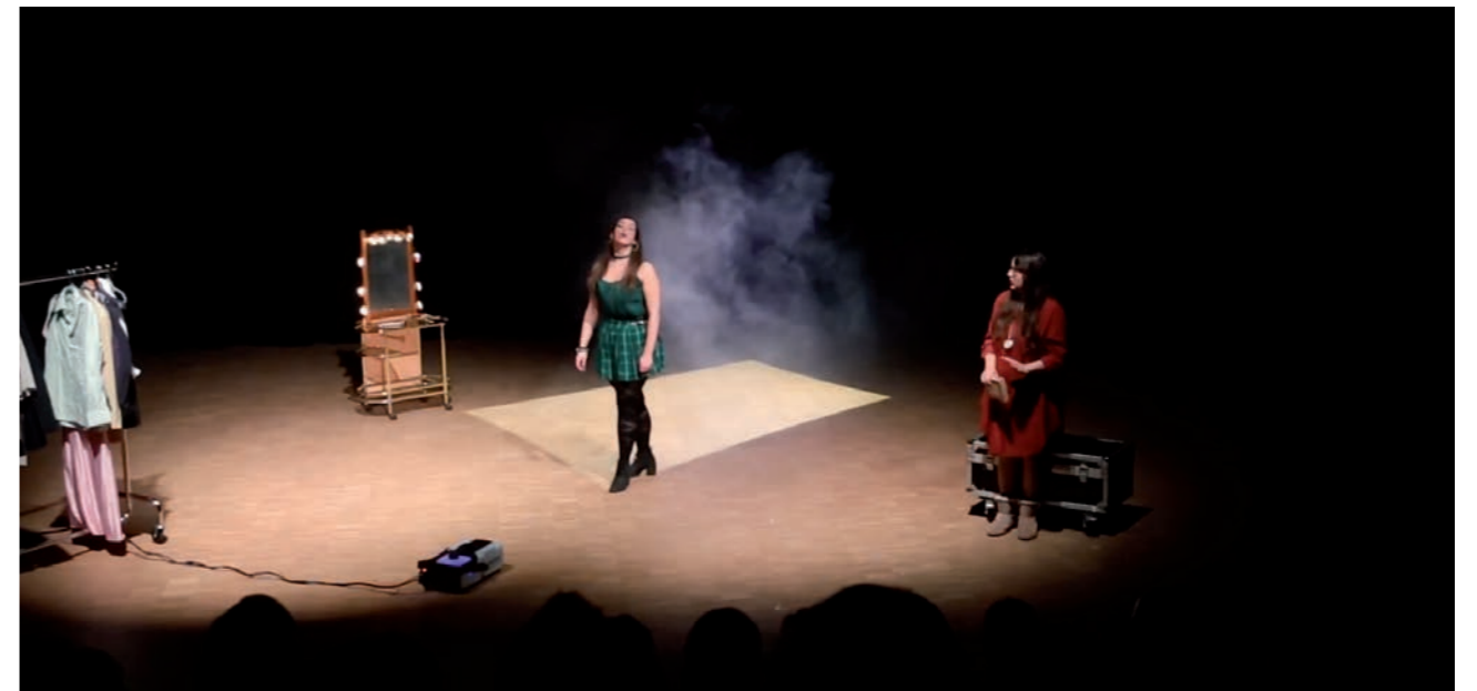
'Augustus ergens op de vlakte' © Theaterspektakel

Misdaad en Straf is geselecteerd voor de shortlist van het Landjuweelfestival. Lees meer info op www.opendoek.be/landjuweelfestival .