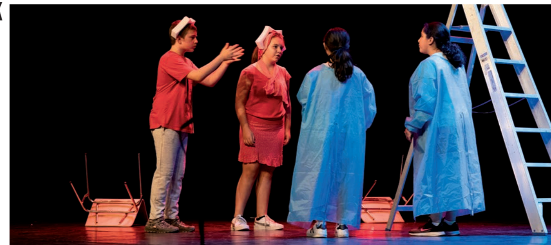
Project V © Klaas Tindemans © Frank Emmers