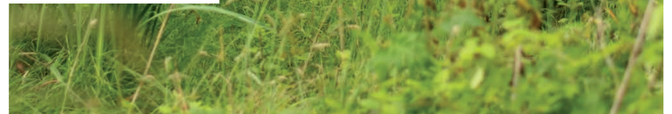
'Grief' - SOW24