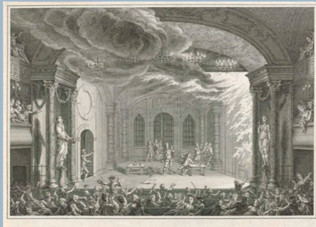
Brand in theater