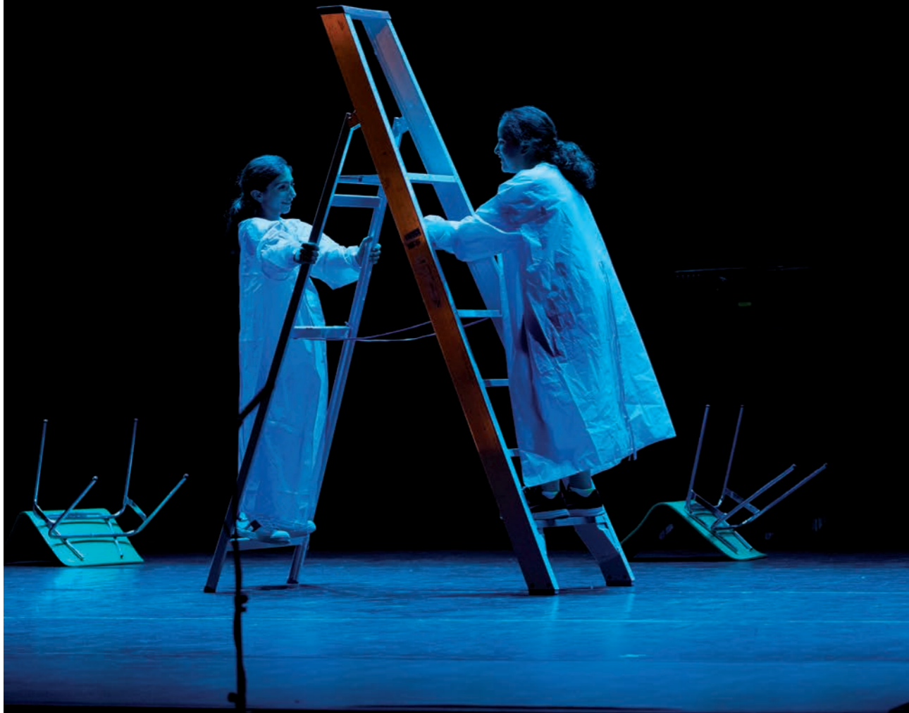
'Project V' © Frank Emmers

We waren nog maar net begonnen met bouwen. Gelukkig weet iedereen dat Brussel een eindeloze werf is.