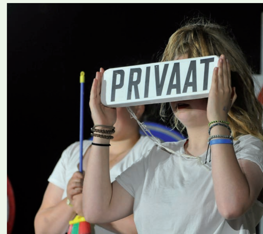
Jongerenstage Spots op West

Kan je maar niet genoeg krijgen van deze grappige fragmenten? Kom dan tijdens Food For Laughs (7 - 9 oktober) onze 'Cinema Caravana' ontdekken. Voor de gelegenheid bouwen we onze OPENDOEK-caravan om tot de kleinste cinema van het land, waar doorlopend komische scènes te bekijken zijn. Meer info over Food For Laughs vind je op pagina 31.