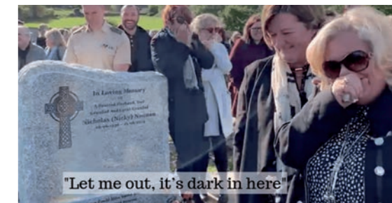
Begrafenishumor

In werkelijkheid was het de verstoorde ademhaling die hoort bij een hartinfarct. Achter de scène was het wél duidelijk dat dit niet bij de act hoorde. De presentator van het programma deed achter het gordijn teken aan het orkest om te beginnen spelen, het reclameblok werd gestart. Tommy Cooper werd met spoed naar een ziekenhuis gebracht, maar de hulp kwam te laat. De volgende ochtend werd zijn overlijden bekend gemaakt in de pers. Pas toen beseften miljoenen tv-kijkers dat ze live ( excusez le mot ) én lachend getuige waren geweest van de dood van de gevierde komiek. Hier bleek de humor onbedoeld te zijn en de lach pijnlijk tragisch. Of was dit misschien toch een mooi einde voor een artiest? Te gaan onder een gulle lach en applaus van je publiek?