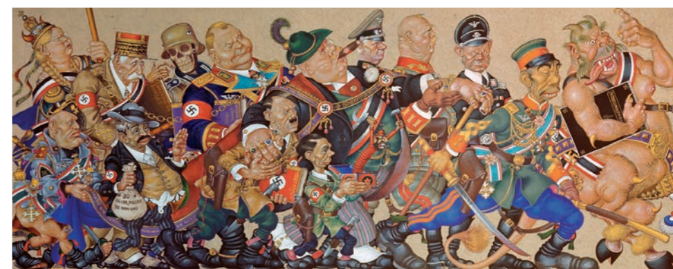
'Satan leads the Ball' - Arthur Szyk © Wikimedia Commons

Een sterk staaltje zelfrelativering is ook wat een Ierse man in 2019 nog zelf had voorbereid voor zijn eigen begrafenis. Toen op de begraafplaats vrienden en familie bij het open graf stonden voor een laatste groet, startte plots een geluidsopname met de stem van de overledene die vanuit de kist leek te komen. Hij leek tegen de binnenkant van de kist te kloppen en riep zaken als "Hallo? Hallo? Laat me hieruit! Het is hier om dood te gaan." De stemming bij de nabestaanden sloeg snel om en de tranen van verdriet werden tranen van het lachen. Jammer dat de overledene zelf die reacties niet meer heeft kunnen zien. Hij zou het vast besterven.