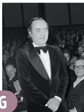
Fons Jansen

Is godsdienst onverenigbaar met humor? Het hangt ervan af. Het helpt in ieder geval als de religie ook een beetje met zichzelf kan lachen. In de vroege jaren '60, toen de katholieke kerk nog veel aanzien en invloed had, trok de Nederlandse cabaretier Fons Jansen al volle zalen met zijn programma 'De Lachende Kerk'. Met diverse woordspelingen en andere grappen, werden onder andere de belachelijke elementen van vastgeroeste religieuze rituelen en van de kerk als instituut naar voren gehaald. De voorstelling is 450 keer gespeeld en bevatte grappen als: "Berouw komt na de zonde. Ik heb maar een keer gehad dat het ervoor kwam. En ik heb er nog spijt van." Daar werd toen smakelijk om gelachen. Nu doet het allemaal heel braaf aan.