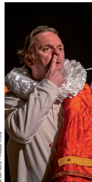
'Ik ben Nora' - Theater Pronk

Niet alleen komedies ontbreken op het Landjuweelfestival. Wat is er bijvoorbeeld mis met goed repertoiretheater, degelijk gebracht in een klassiek decor? Waarom moet het altijd 'speciaal' zijn? Er zijn nochtans voorbeelden genoeg van