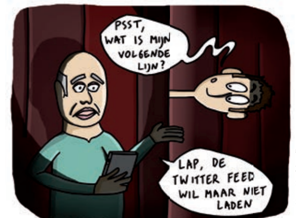
AAN DE VOORSTELLING BOOM KON HET PUBLIEK MEESCHRIJVEN VIA SOCIALE MEDIA

Als je alleen maar inzet op online communicatie, verlies je een deel van je doelpubliek. Daarom is het belangrijk om online en offline communicatie te combineren. Dit helpt niet alleen om mensen zonder internet te bereiken, het werkt ook als herhaling. Mensen die 's avonds je evenement zien passeren en de volgende dag in de groentewinkel je affiche zien hangen, worden nogmaals herinnerd aan je voorstelling. Er zijn overigens heel wat ludieke manieren om offline reclame te maken voor je voorstelling. Gebruik je verbeelding om reclame te maken op je wagen, op de markt, vanop de fiets, in de frituur... Opvallen is de boodschap.