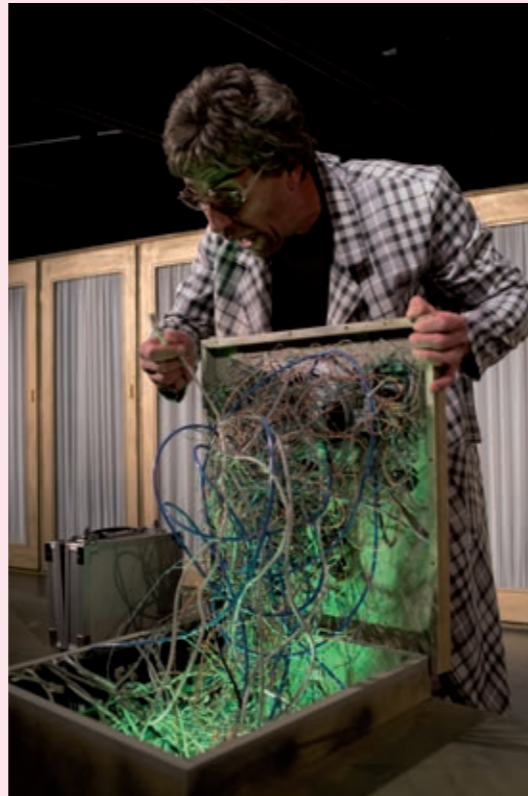
'Jaja maar neenee' - Theater Hoogspanning

“Tijdens festivals kan niet alleen het publiek proeven van verschillende theaterrecepten. Makers krijgen de kans om buiten hun eigen grenzen te treden en rijker naar de eigen scène terug te keren.”