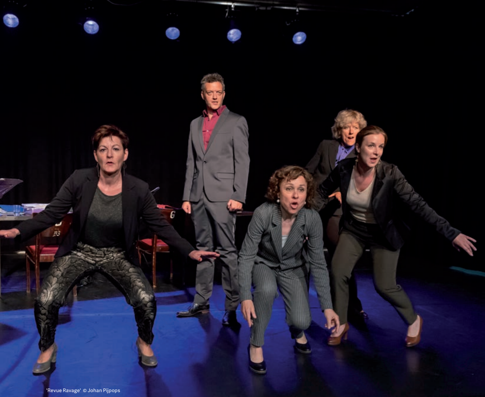
'Revue Ravage'