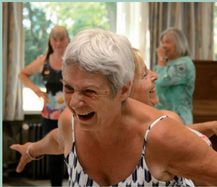
AGE on stAGE © Dominic Depreuw