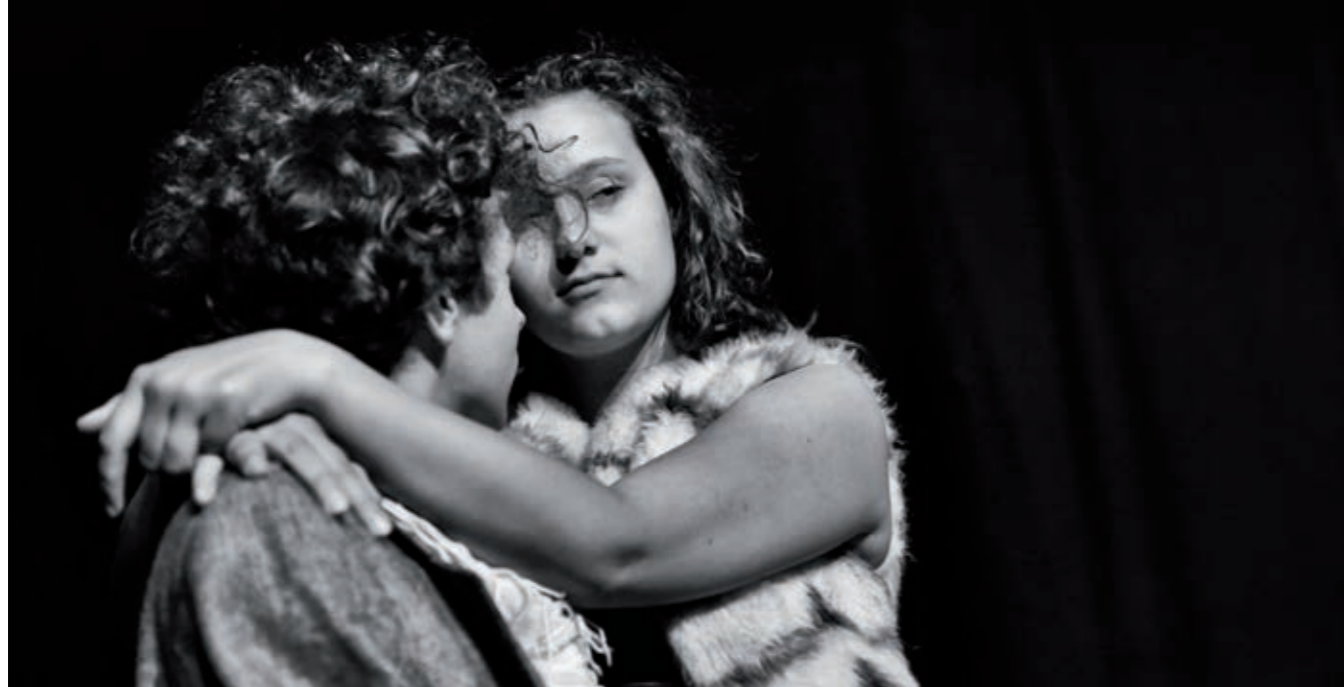
'Ubu' - Kunst en Geest © Johan Wynants