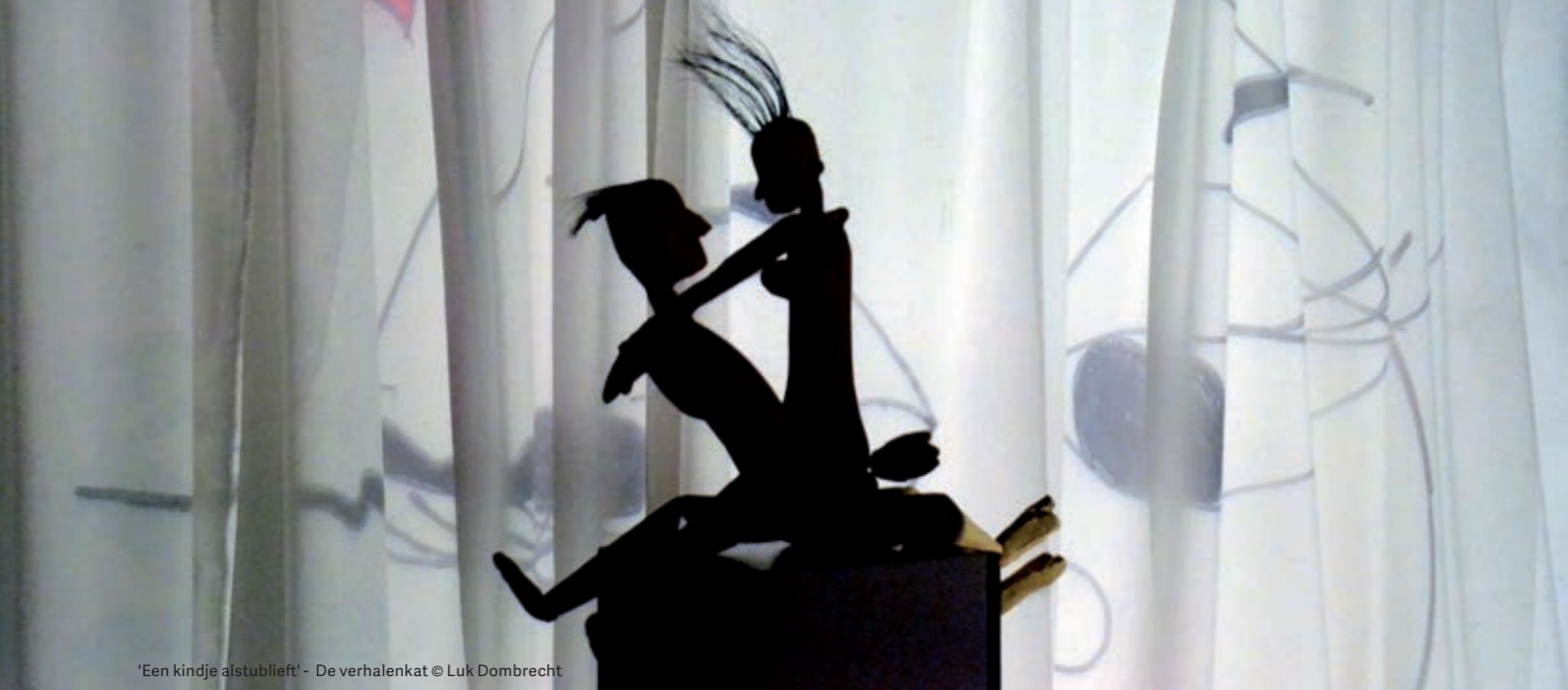
'Een kindje alstublieft' - De verhalenkat © Luk Dombrecht