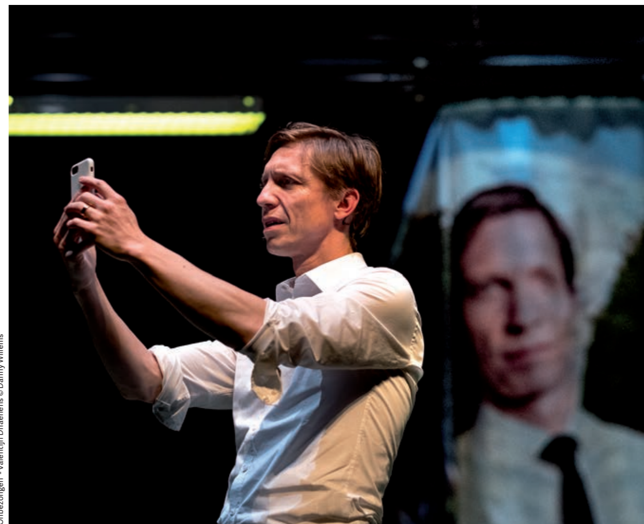
‘Onbezongen’ - Valentijn Dhaenens

“Veel politici zeggen dat ze de taferelen uit ‘Onbezongen’ herkennen. Alleen gaat het nooit over henzelf.”