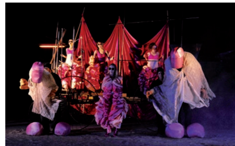
'Titus' - Theater FroeFroe en Compagnie Lodewijk/Louis

Maar voor wie het écht lekker goor wil: ga naar de 16+ poppenanimatiefilm 'The Happytime Murders (No sesame, all street)' van Brian Henson (zoon van Jim Henson, de vader van 'Sesamstraat' en 'The Muppets'), met seks, geweld enzovoort. Meer info over erotiek en poppenspel vind je op www.poppenspelmuseumbibliotheek.nl/pdf/Pamflet41.pdf .