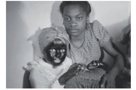
Shirley Temple in 'The Littlest Rebel'

De Verenigde Staten schaften slavernij pas af in 1865. Zwarte mensen werden plots als een bedreiging gezien, waardoor de minstrelkunst een extra boost kreeg. De idiote blackface-personages waren tenslotte ideaal om de angsten van de witte bevolking te bezweren. Deze theatervorm toont duidelijk hoe blackface, onbegrip en onderdrukking met elkaar verweven zijn. Want wie durft nu nog te beweren dat Jim Crow gelukkig was op de plantages?