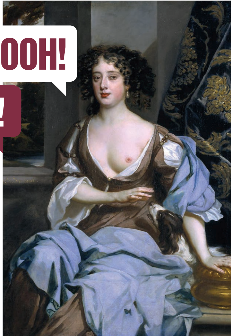
Portret van Margaret Hughes

Het is een periode van grote veranderingen in het Engelse theater. Er heerst bijvoorbeeld een discussie uit bezorgdheid dat het tegennatuurlijk zou zijn dat mannen zich als vrouwen verkleden. Er worden associaties gemaakt met homoseksualiteit, op dat moment ook een absoluut taboe. Dat inspireert de toenmalige koning Karel II van Engeland, zelf een gretig theaterbezoeker, om in 1662 een koninklijk bevel uit te vaardigen dat voortaan alle vrouwenrollen alleen nog maar mogen worden gespeeld door vrouwen.