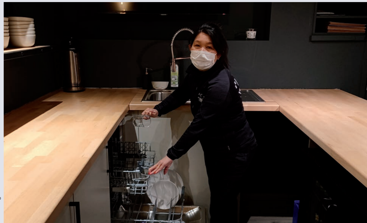
Phun Neang © Ineke Sissau

“Dat betekent niet dat alles even leuk is natuurlijk. Zeker als er confetti of valse sneeuw gebruikt wordt tijdens een voorstelling, en die waait de zaal in. Dat plakt vreselijk, en dan is dat op je knieën stoel per stoel afdaggen, om alles schoon te krijgen. Dat hoort bij de job natuurlijk, en het podium is er vaak nog erger aan toe! Gelukkig moeten de technici dat doen, dan heb ik wel medelijden. Soms sturen we dan foto's door naar elkaar en zetten we erbij: 'Wat is er hier nu weer gebeurd?' (lacht).”