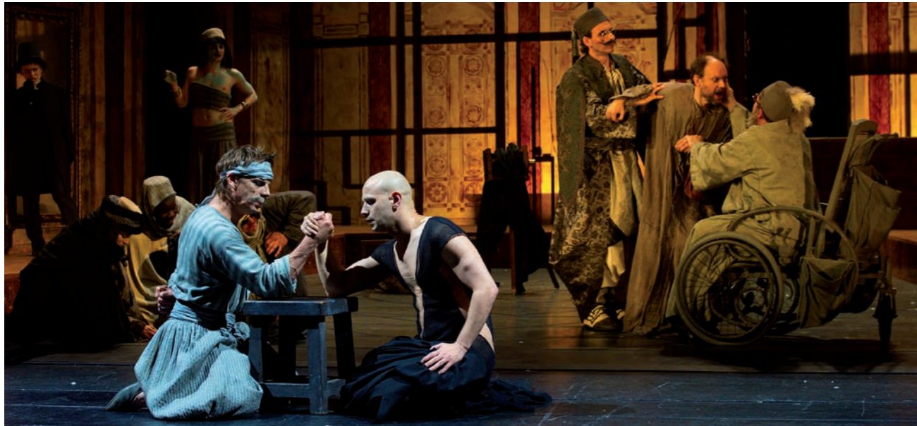
'Rituel pour une métamorphose' - Comédie Française