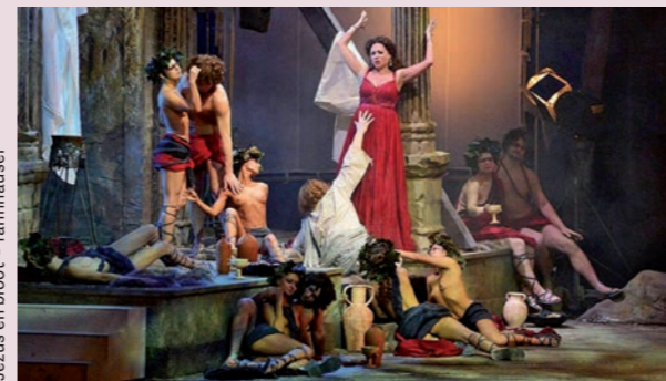
'Jezus en bloot' - Tannhäuser

Naaktheid en seks zijn gewoonlijk het eerste waar je aan denkt als het woord taboe valt. De voorbeelden van schandalen door bloot op de scène zijn legio. Gelukkig kunnen we eindelijk de natuurlijke schoonheid van het lichaam weer wat waarderen zonder misplaatste verontwaardiging. Hoewel, voor de grote godsdiensten blijft seks een lastige aangelegenheid. Eigenlijk is elke religie samen te vatten als "met God f**k je niet". Christenen bijvoorbeeld zien hun held Jezus nog altijd het liefst als een vrijgezel die zich niet overgaf aan zoiets onreins als seks (voor het huwelijk).