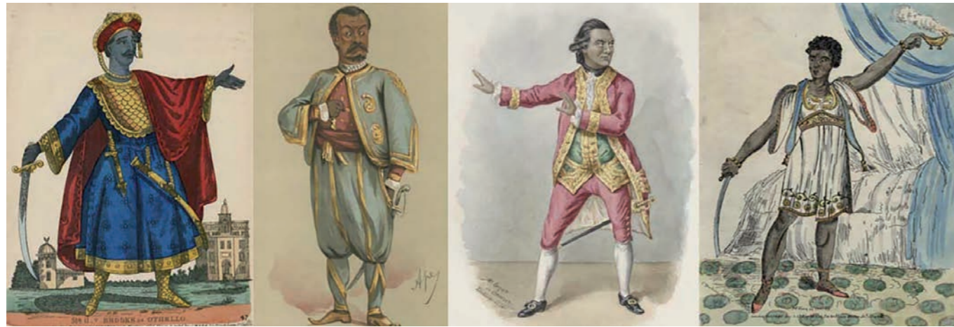
Othello Blackface 18-19 century