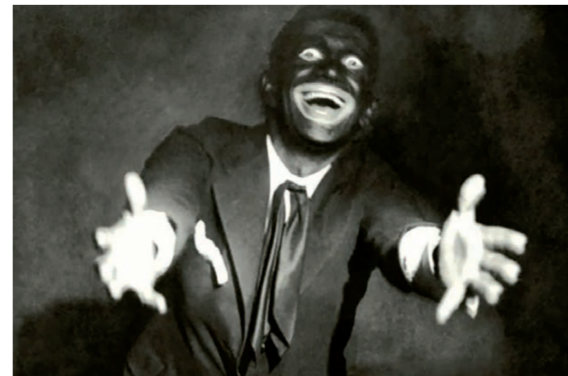
Zanger Al Jolson in blackface

En theater... dat is het mooiste wat er is. Het valt niet te rijmen met het gebruik van blackface. Blijf dus weg van die zwarte schmink. Zo simpel is het.