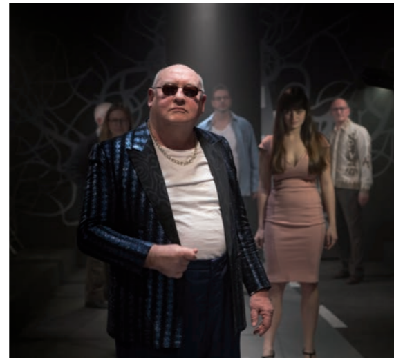
'Tand om tand' - Theater Pact

Zorg ervoor dat je de voorstelling voor je toeschouwers voldoende kadert en dat ze weten waaraan ze zich moeten verwachten. Zorg eventueel voor een 'trigger warning' en waak erover dat toeschouwers die achteraf met vragen zitten, weten waar ze terecht kunnen (het gratis nummer van de Zelfmoordlijn 1813, de hulplijn voor geweld en misbruik 1712...).